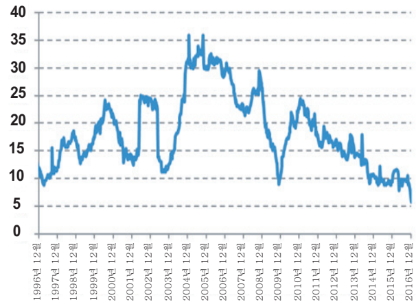
인도 상업 신용 성장률(yoy %)